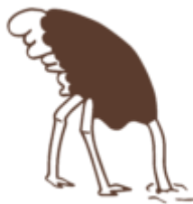
Ego-type de Struisvogel