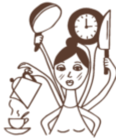
Ego-type de Octopus

Jij vraagt heel veel van jezelf en vaak ook van anderen. Je bent een doener met veel ambities, maar je staat niet altijd stil bij je gevoelens. Ook aan wat jouw lichaam je laat voelen, ga je regelmatig voorbij. Doordat je zo druk bent, wordt je eetmoment vaak je ontspanningsmoment. Bijvoorbeeld 's avonds en dan ga jij helemaal los met eten.